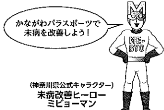
(神奈川県公式キャラクター) 未病改善ヒーロー ミビョーマン