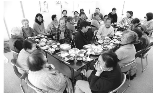
↑ 拠り所づくりの支援によりスタートしたサロン活動の様子