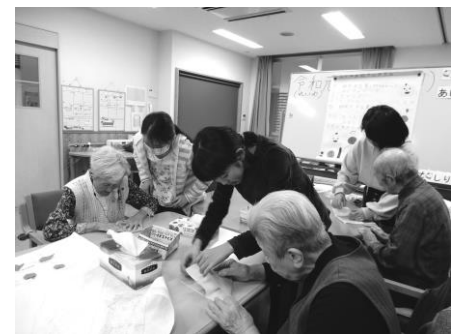
↑ 福祉教育事業の様子