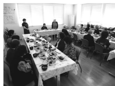
← ふれあい昼食会の様子