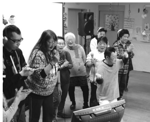
↑ 年末たすけあい運動配分事業の様子