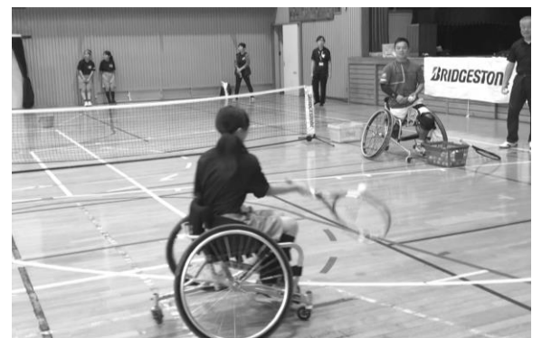
↑ パラスポーツフェスティバルの様子