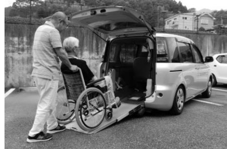
↑ 移送サービス事業の様子